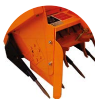
Kit dents de ramassage ( Option )