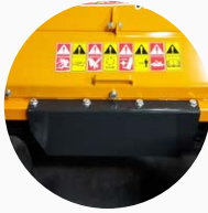
Accès facile au rotor