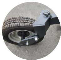
Roues pivotantes ( Option )