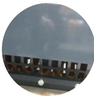
Grille de calibrage ( Option )